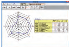
評点グラフ表示機能