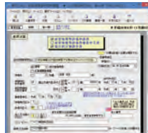
経審・経営状況分析申請書類