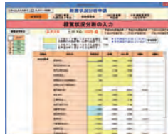
かんたんシミュレーション

※フルサービスプランでご申請の場合は、すべての機能を無料にてご利用いただけます。エコノミープランでのご申請の場合は一部機能が制限されます。 ※ご申請がない場合でも入力・印刷等の基本機能は継続してご利用いただくことができ、一部制限された機能は有償にて更新していただくことができます。