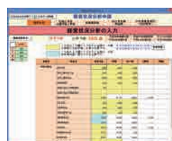
かんたんシミュレーション