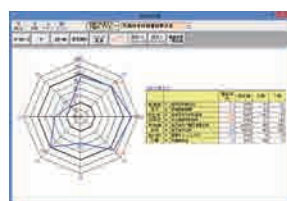
評点グラフ表示機能