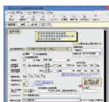
経審・経営状況分析申請書類